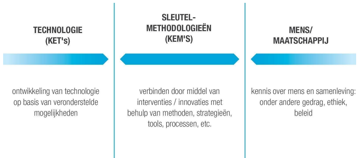
Figuur 1: KEM's integreren kennis van mens en maatschappij met kansen vanuit technologie.

KEM's dragen bij aan de integratie van kennis uit de sociale- en geesteswetenschappen (bijvoorbeeld kennis over motivatie, gedrag, ethiek of organisaties) met de kansen die technologische ontwikkelingen ons bieden. Zo ondersteunen ze de ontwikkeling van zinvolle toepassingen en betekenisvolle interventies. 3 KEM's beantwoorden daarmee vragen als: hoe kunnen interventies inspelen op de verbanden die sociaal-wetenschappelijke theorieën blootleggen? Hoe kunnen interventies ingrijpen in die beschreven werkelijkheid om mensen enthousiast te maken, te betrekken, te empoweren , of hun gedrag te beïnvloeden? Hoe kan ingegrepen worden in een systeem om een gewenste verandering teweeg te brengen?